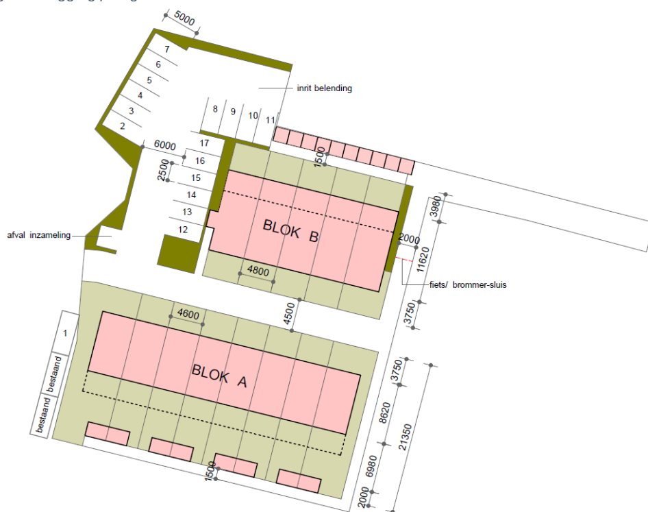
Figuur 2: Plangebied met blok A: eengezinswoningen en blok B: boven- en benedenwoningen