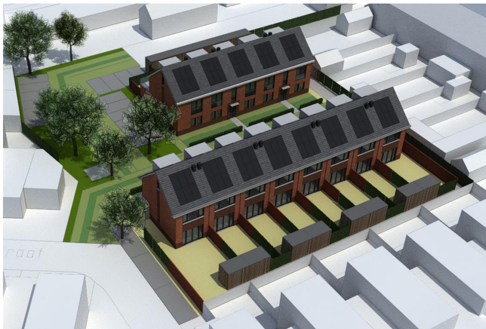
Figuur 3: Plangebied in vogelvlucht